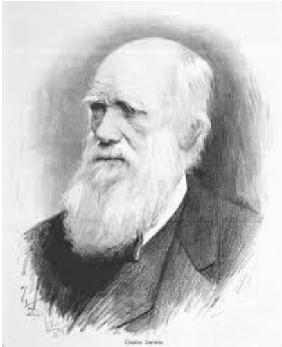
Fig. 1.3 (Charles Robert Darwin, 12 de febrero de 1809 – 19 de abril de 1882).

El naturalista inglés Charles Darwin realizó las más importantes adaptaciones para explicar la evolución de los seres vivos Fig. 1.3