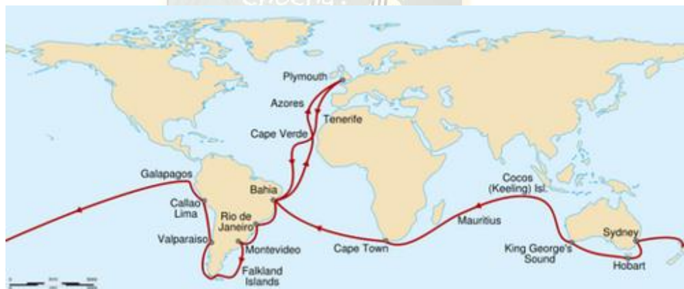
Fig.1.4 El recorrido de Darwin a bordo del barco Beagle le permitió conocer la flora, fauna y fósiles de diversos países.