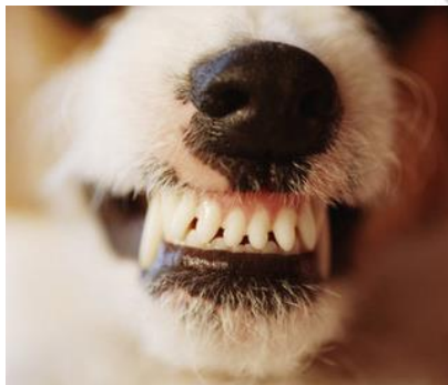
Fig. 1.1 Los dientes filosos de los perros son adaptaciones morfológicas. Estos les ayudan a desgarrar más fácilmente la carne con la que se alimentan.

Las adaptaciones que involucran alguna estructura anatómica se llaman morfológicas Fig.1.1 ; las que se relacionan con las funciones, como la producción de sustancias venenosas que producen algunas plantas se llaman fisiológicas; mientras que las de comportamiento son aquellas relacionadas con ciertas conductas Fig.1.2 (Cota, E.2012)